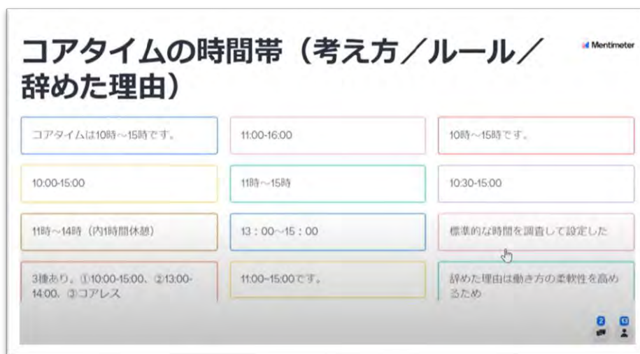
▲コアタイムの時間帯（考え方/ルール/辞めた理由）に関するアンケートの回答

トピックの1つである「コアタイムの時間帯（考え方/ルール/辞めた理由）」を回答いただく場面では、コアタイムは10:00～15:00という回答が多く、中には働き方の柔軟性を高めるためにコアタイムを廃止したという意見もありました。参加者自身の言葉で回答いただくことで、各社のリアルな取り組みを参加者同士で共有いただくことができました。