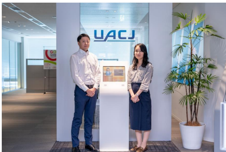
(ビジネスサポート本部人事部)

本プロジェクトは、UACJの人事部門にとって初めての経験であり、かつ大きな財産となりました。成功に導いて下さった WHI 様の熱意と的確なアドバイスによるご支援に感謝いたします。今後も、人事部門を取り巻く環境は大きく変化していくと思いますが、持続可能で安定したオペレーション業務を基盤とし、戦略的人事部門の構築に向け、さらにチャレンジして参ります。