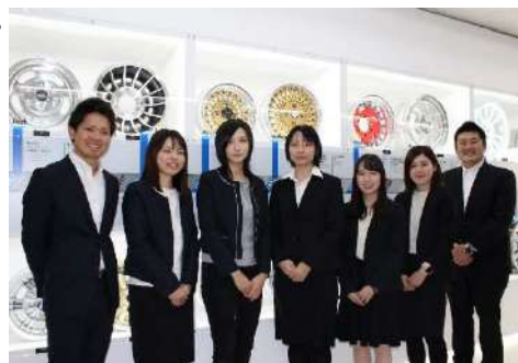
エンケイ株式会社 業務統括本部 人事グループ

そして、企業としての持続的な成長を実現するため、2019年には、人材情報の見える化を可能にするCTMを導入しました。今後さらに、COMPANYに蓄積された情報を最大限活用できるタレントマネジメントを推進し、国内だけでなくグローバルでの人材情報管理の強化と、後継者管理・育成を進め、統合的な基盤の整備を進めてまいります。